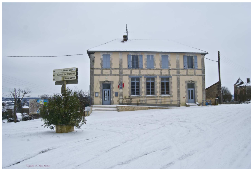
LA MAIRIE SOUS LA NEIGE 02 2012