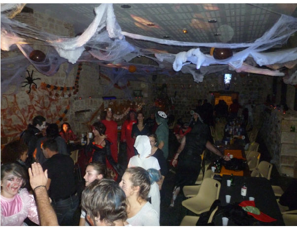
HALLOWEEN 10 2011