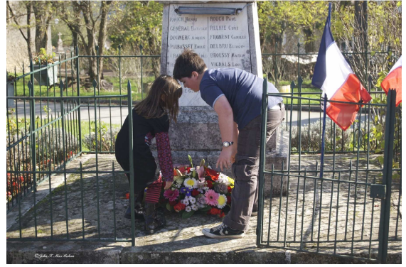
COMMEMORATION 11 novembre 2011