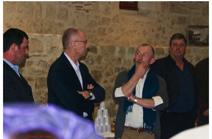
VOEUX DU MAIRE 01 2012