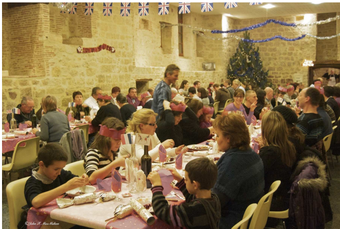
REPAS DE NOËL ANGLAIS 12 2011